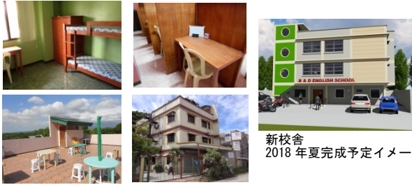
新校舎 2018年夏完成予定イメージ

校舎と宿舎が一体型のため、レッスン時に移動する必要がありません。食事や勉強、休憩でもお使いいただける共有スペースやラウンジもあります。